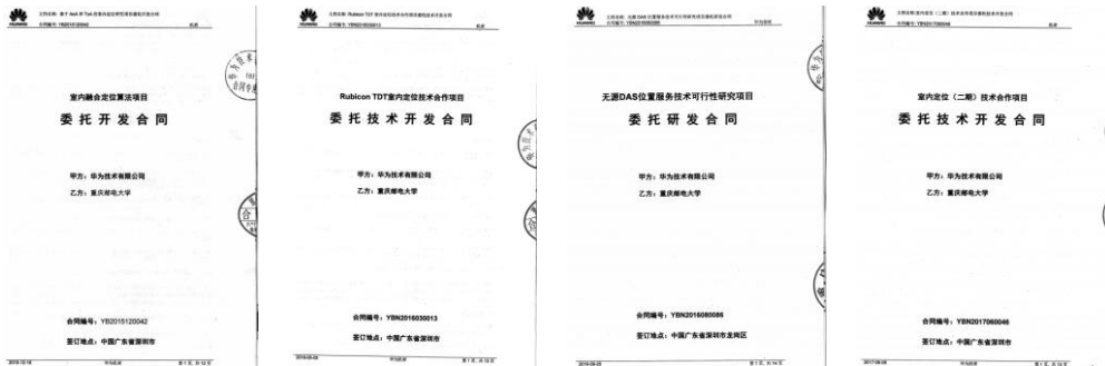
图 1 华为公司委托合同

(1) 在室内定位技术研究及工程应用方面，与华为技术有限公司合作开发了“AOA/TOA 室内定位系统”，重点解决室内 AOA 与 TOA 的联合定位问题；合作开发了“Rubicon TDT 室内定位系统”，重点解决室内多天线蓝牙定位问题；合作开发了“无源 DAS 位置服务系统”，重点解决室内分布式天线系统的定位问题；以及合作开发了“PDR/指纹/AOA 室内定位系统（二期）”，重点解决基于惯导/无线信号的室内跨楼层定位问题（图 1）。与中兴通讯股份有限公司合作开发了“AGPS 精度提升系统”，重点解决现有室内辅助 GPS 定位系统的精度增强问题（图 2）。与中国电子科技集团公司第三十六研究所合作开发了“非合作目标室内定位系统”，重点解决针对室内特殊用户的信号侦听与定位问题（图 3）。与中国人民解放军总参谋部第五十七研究所合作开发了“WCDMA 同频干扰抵消系统”，重点解决室内 WCDMA 定位信号的干扰抵消问题（图 4）。同时，申报了国家自然科学基金项目(61301126)“独立于位置指纹的 WiFi 室内基因测序定位算法”，重点解决室内 WiFi 指纹定位的数据库构建开销问题（图 5）。