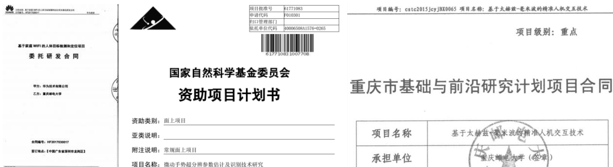
图 9 华为公司委托合同 图 10 国家自然科学基金 图 11 重庆市基础与前沿研究计划项目（重点项目）

(3) 在人机交互技术研究及工程应用方面，与华为技术有限公司合作开发了“家庭 WiFi 人体目标检测与定位系统”，重点解决家用 WiFi 路由器对于室内空间中人体等物体运动的感知问题且该系统已在华为路由 Q2 上得到商用（图 9）。同时，参与申报了（排名第 2）国家自然科学基金项目（61771083）“微动手势超分辨参数估计及识别技术研究”，重点解决人机交互环境下的微动手势识别及定位问题（图 10），以及重庆市基础与前沿研究计划项目（重点项目）（cstc2015jcyjBX0065）“基于太赫兹-毫米波的精准确人交互技术”，重点解决太赫兹/毫米波环境下微小、微动目标的毫米级精度定位问题（图 11）。